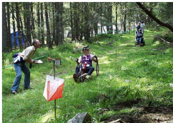
Os competidores estudam o controle 13 (vendo-se uma baliza de Orientação Pedestre em primeiro plano)

Alguns controles têm tempo cronometrado para a tomada de decisão, o qual é registado nesse momento para desempate entre aqueles que tenham o mesmo número de respostas correctas.