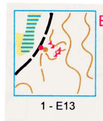
Mapa de soluções (com o ponto de decisão e as posições das balizas)